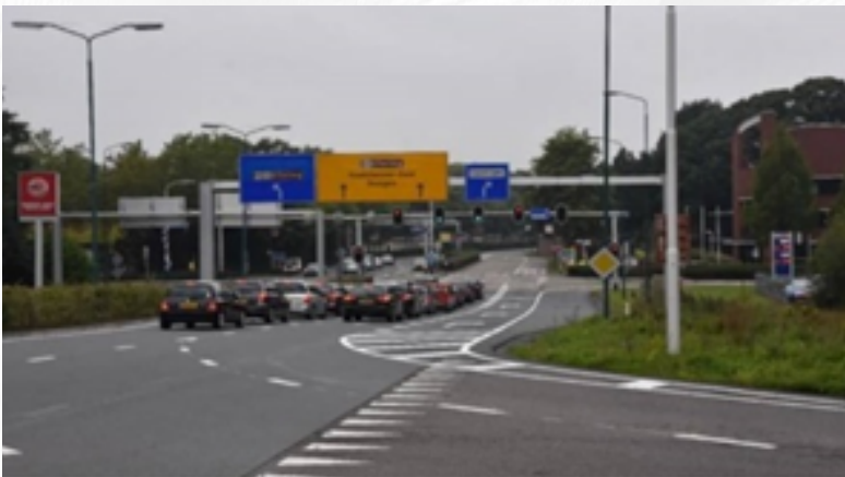
Wisselstroken Efteling Kaatsheuvel